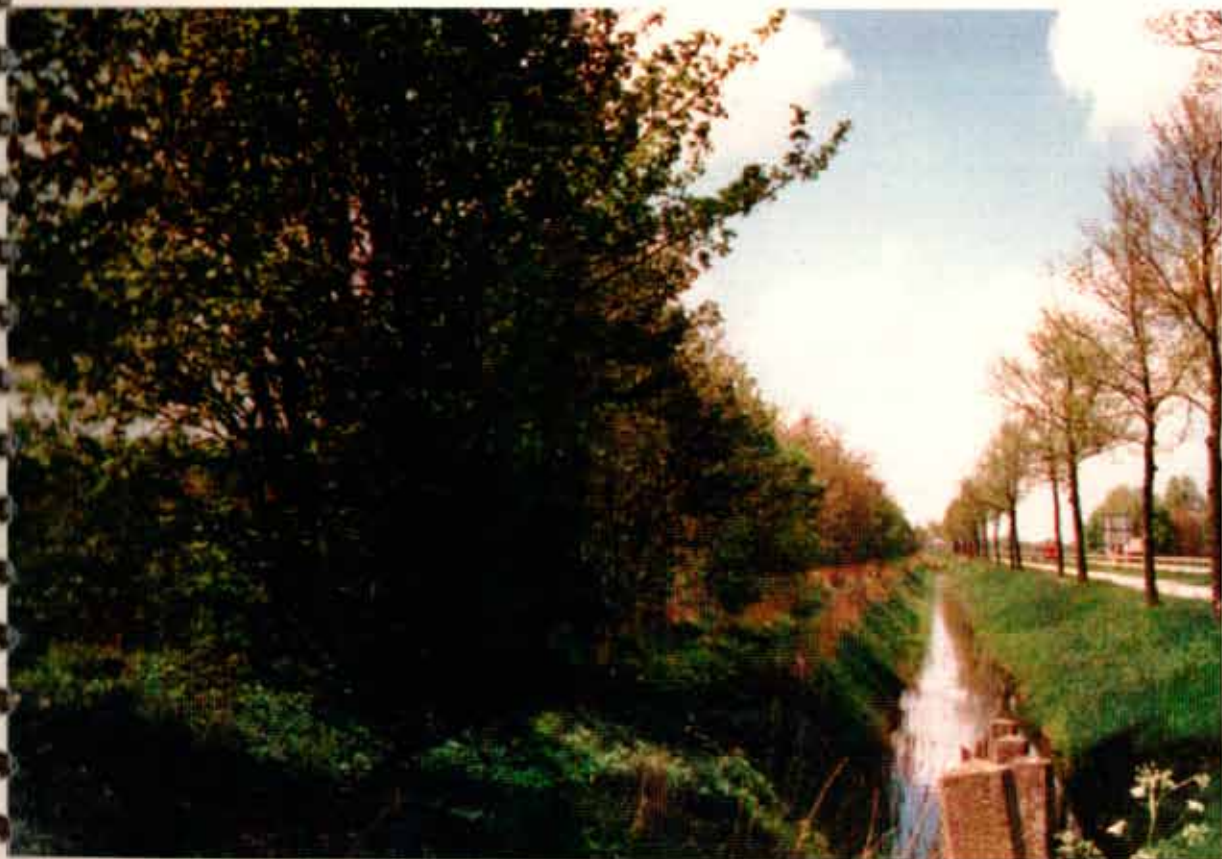
Afbeelding | Uitbreidingsgebied II. ( Het Fjouwerkant )

Rapport opgesteld in opdracht van de Stichting Op Toutenburg.